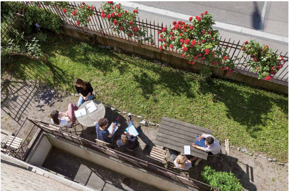
Das historische Industriegebäude an der Schulhausstrasse bietet viel Platz für eine gute, praxisbezogene Lernatmosphäre.